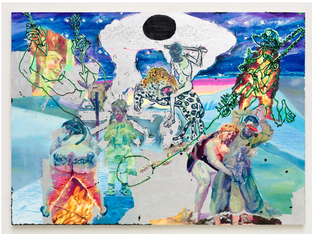
Batismo na carne