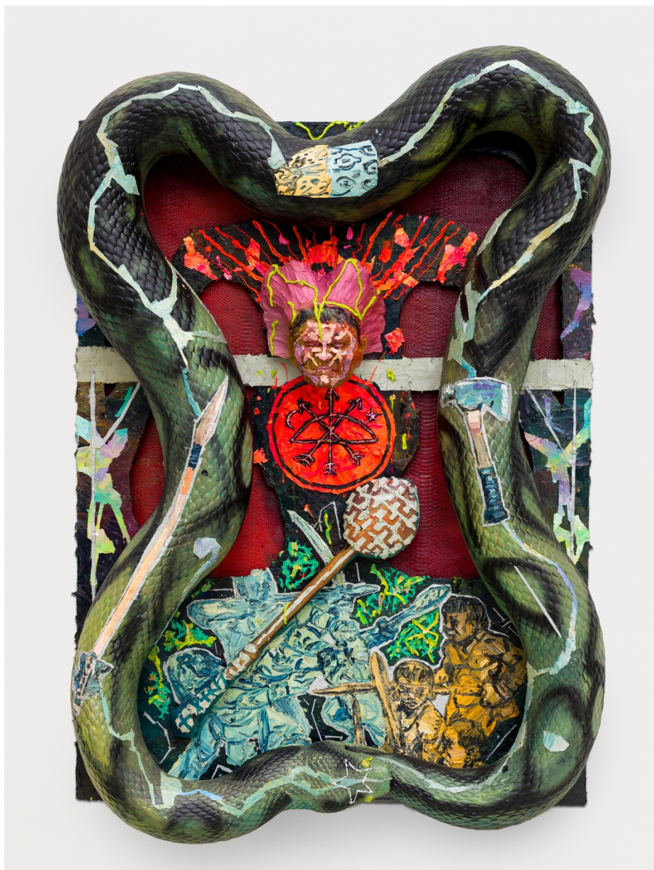
Ubirajara Peito de Aço

óleo, acrílica, tinta spray sobre fibra de vidro com poliéster e couro sintético