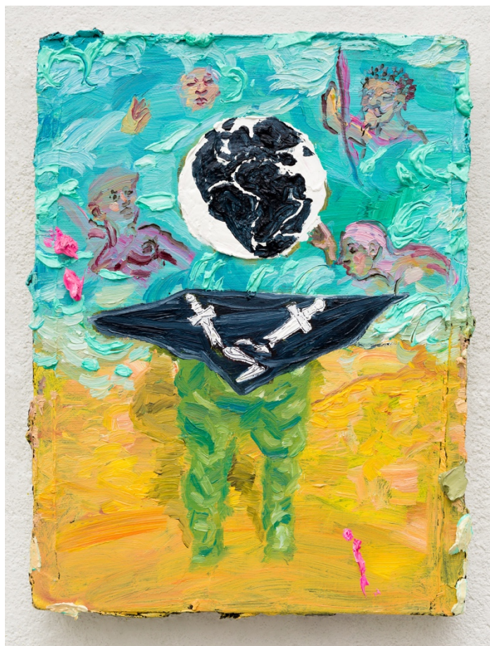
O fim do ódio