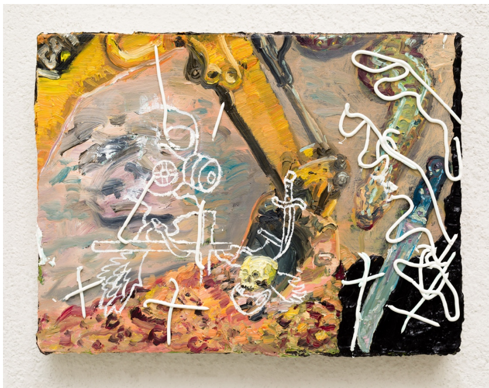
Vestígio (sessões da quarentena)