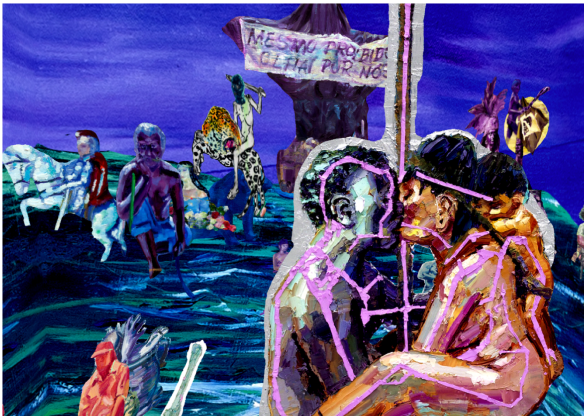
Portal Crepuscular 360° (série Animal Crepuscular)