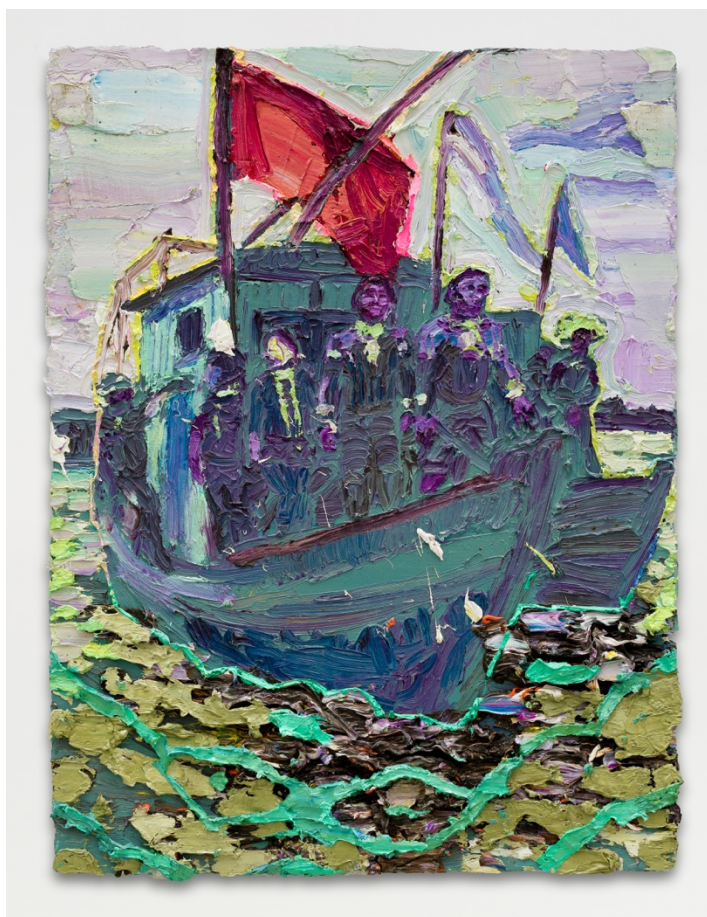
Barca da mata