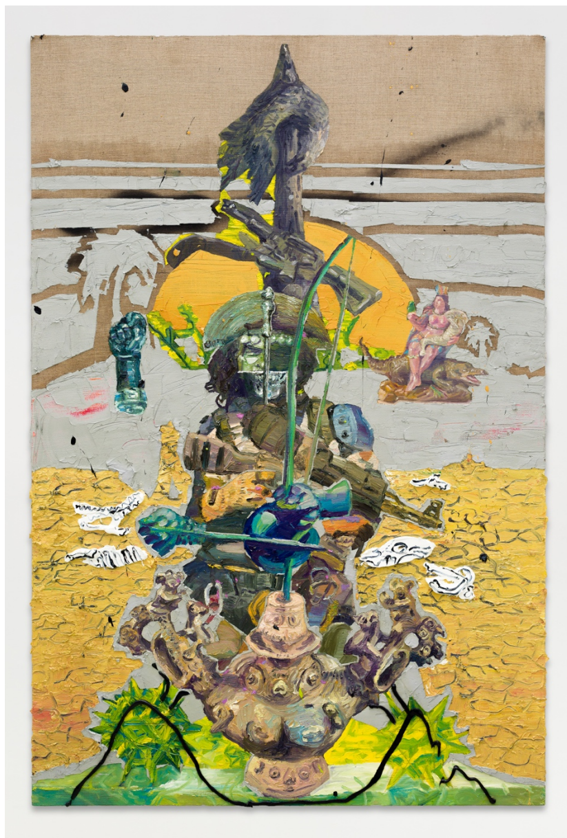
Ogum Corisco no útero da terra - para Glauber Rocha e Naná Vasconcelos