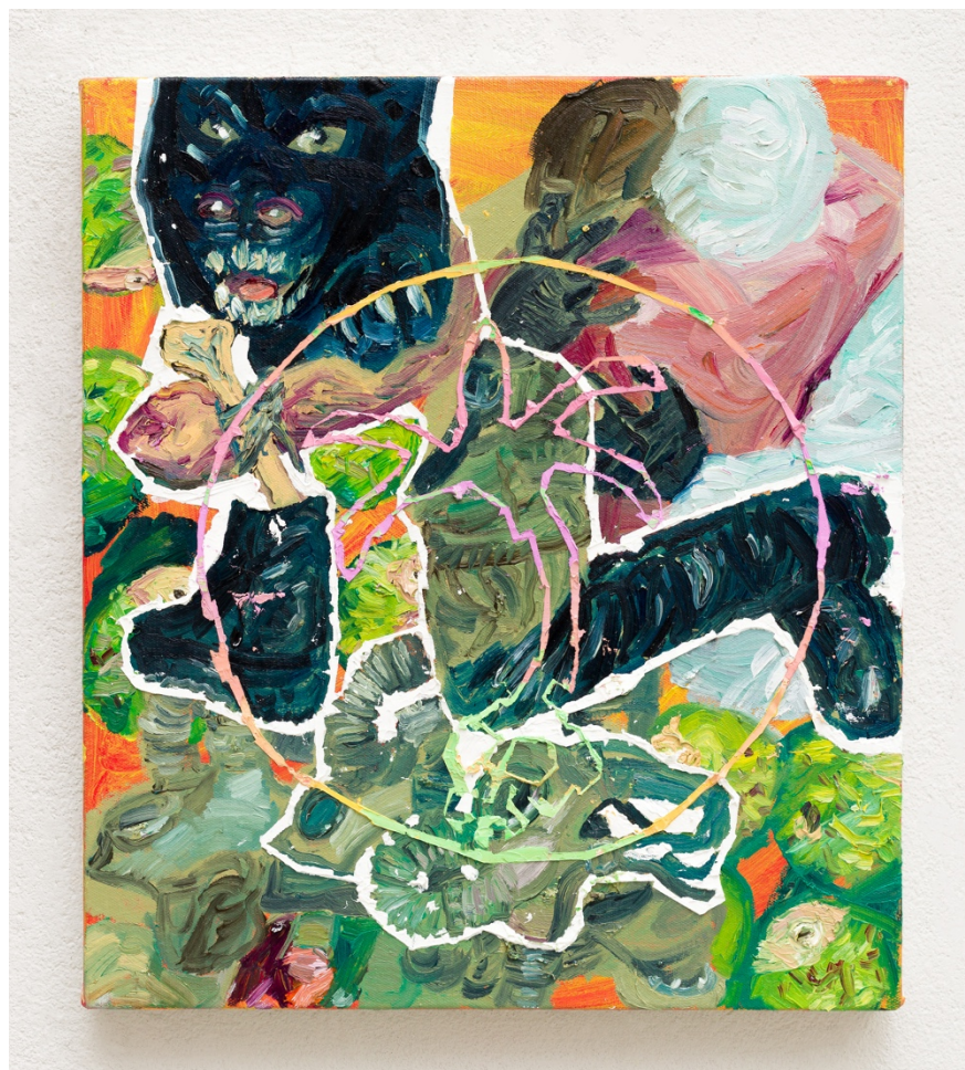
2020 (série Animal Crepuscular )