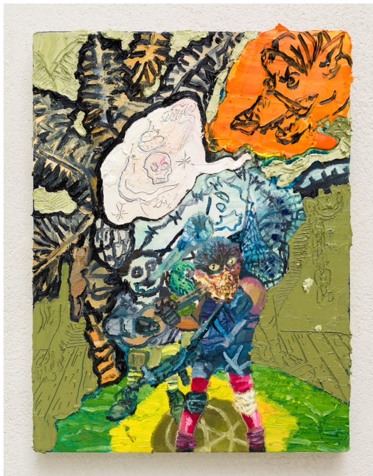
A trova ante o porco xingador (sessões da quarentena)