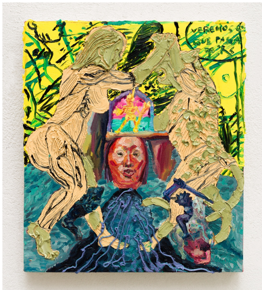
Luta de dentro (série Animal Crepuscular )