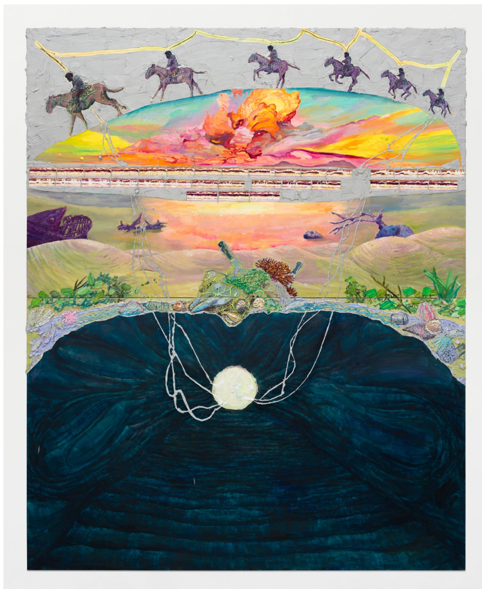
A vinda de Ogum Beira-mar/ fio de prata