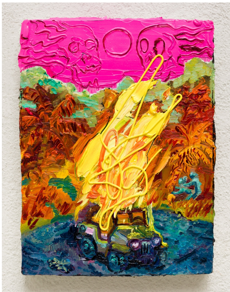
Imóvel e à espera (sessões da quarentena)