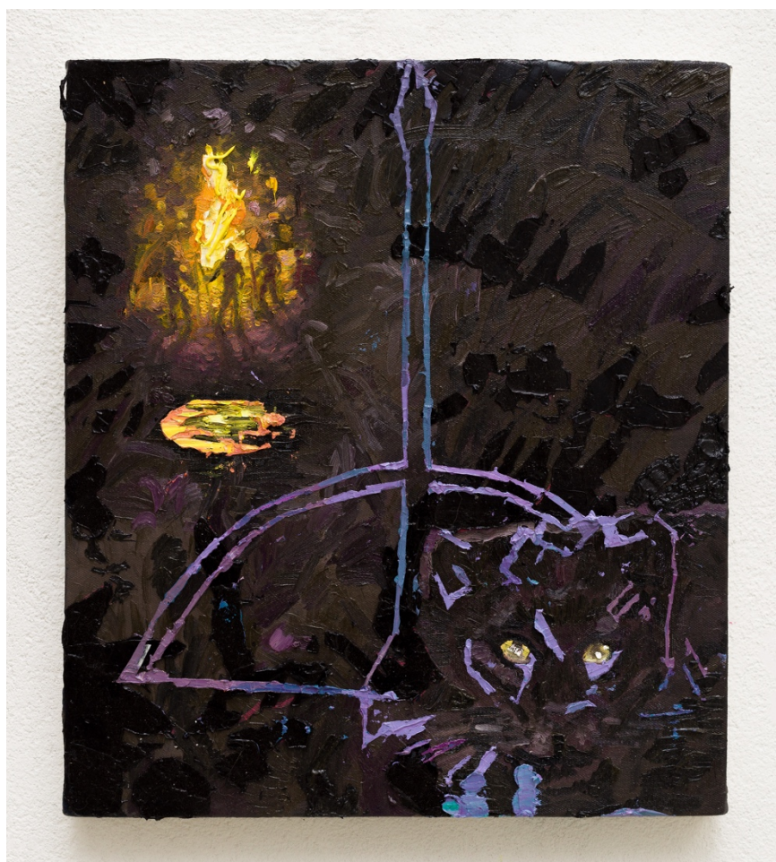
Noite da onça preta (série Animal Crepuscular )