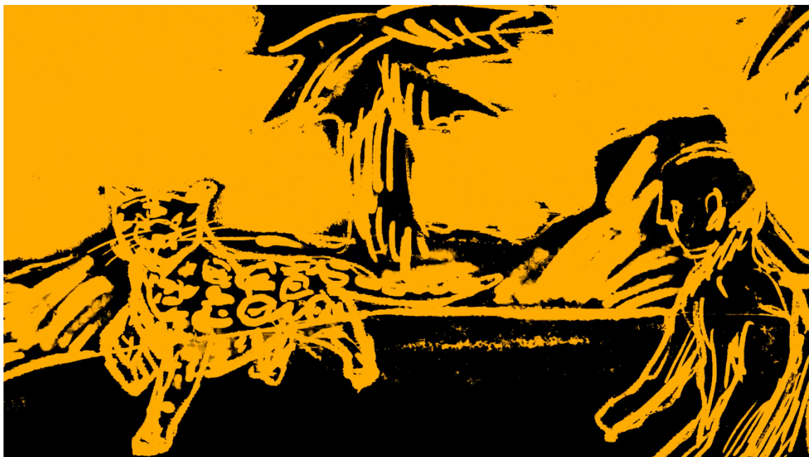
Caçada da onça sob o sol de dentro (série Animal Crepuscular )