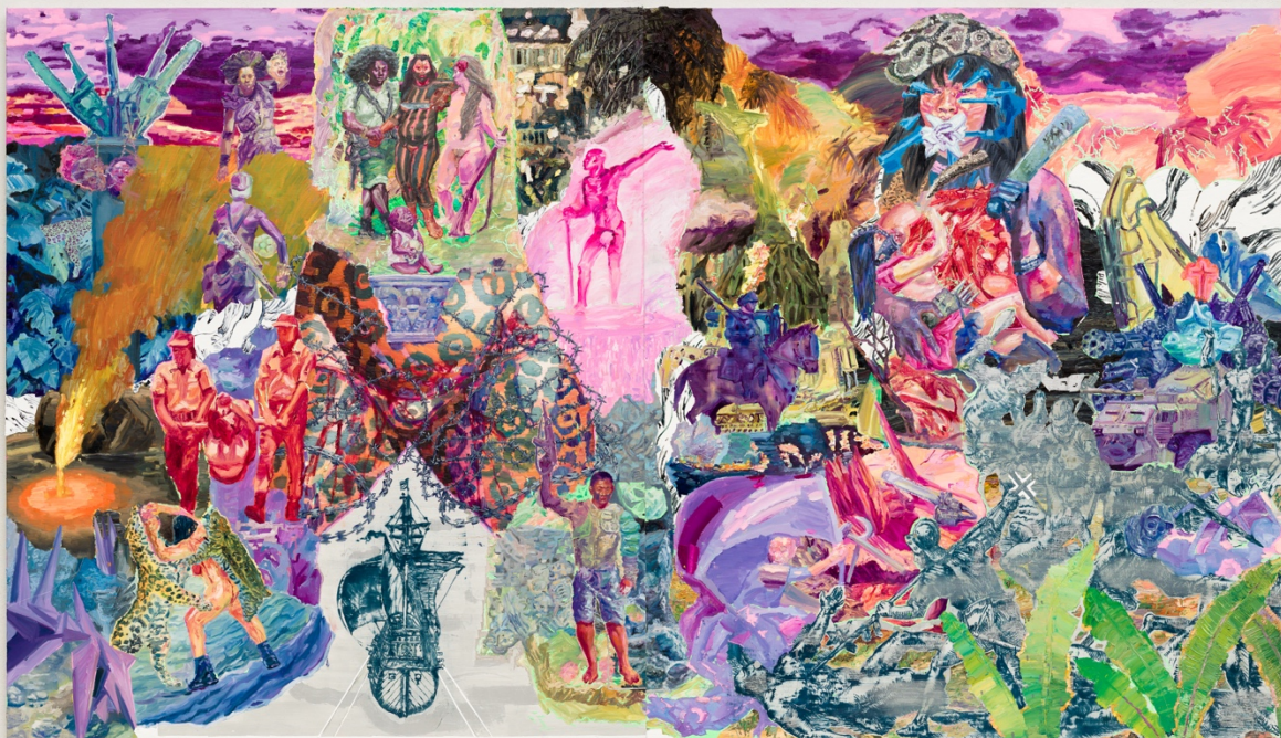
Américas, a queima - após Theodore de Bry