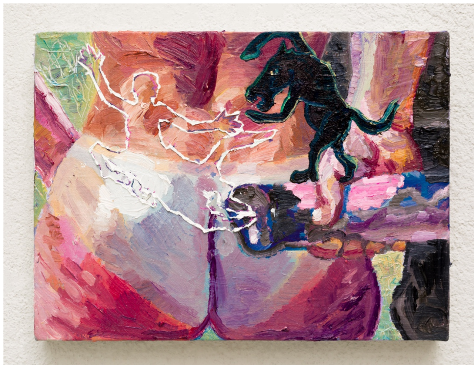
Tensão (sessões da quarentena)